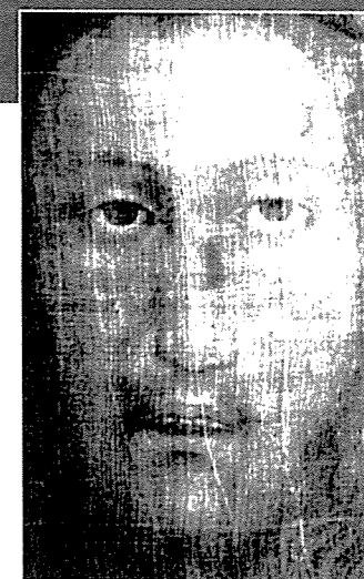
Le voile de Manoppello.

«L'Evangile, tel qu'il m'a été révélé», Tome 6, pp. 183-184